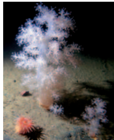
Měkký korál Gersemia fruticosa

K ostrovu Kiškin, který leží u vstupu do Čupské zátoky, je to několik hodin plavby. Lokalitu se skalním převisem a s korály máme hledat u velké skalní rozsedliny v ostrovu. Tu nacházíme celkem snadno. Od ní známe vzdálenost, směr a hloubku. Oblékáme se, bereme kamery a fotoaparáty a zodiaky nás vezou k ostrovu. Skála nad hladinou je téměř vertikální stěna a my za chvíli zjišťujeme, že stejně vypadá i pod vodou. Klesáme do 27 m a vydáváme se