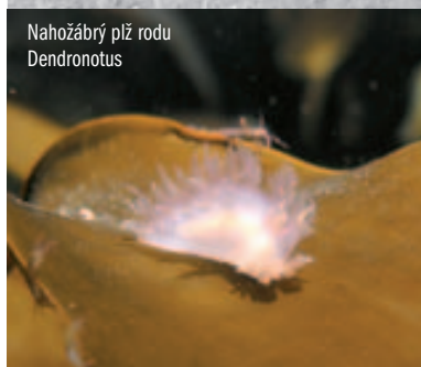
Nahožábří plž rodu Dendronotus