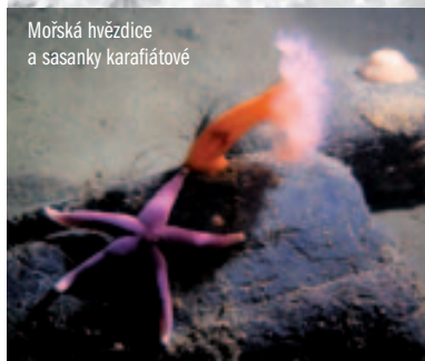
Mořská hvězdice a sasanky karafiátové