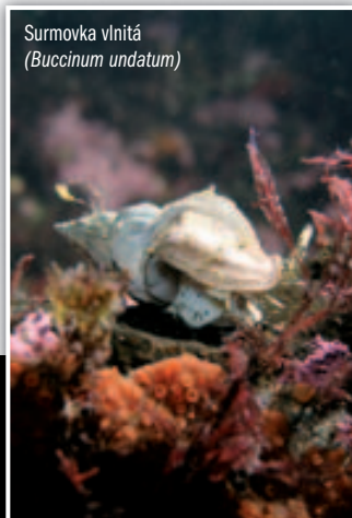
Surmovka vlnitá ( Buccinum undatum )

plánovaným směrem. Viditelnost je více než 15 m, ale v této hloubce již musíme používat svítilny. Hledáme asi čtvrt hodiny. Najednou jakoby skála uskočila o 3 metry. Skalní převis je přímo před námi. Jeho horizontální délka je přibližně 30 metrů a hloubka se mění od 1,5 m do 5 m. Z převisu visí měkké korály, z nichž ty nejdelší měří jeden metr. Je to úchvatná podívaná. Některé jsou sněhově bílé, jiné růžové, další lososově oranžové. Mezi nimi jsou místa porostlá Sasankami