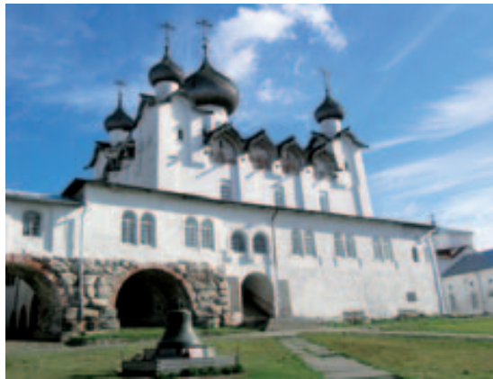
Komplex kláštera na Solovětském ostrově je od roku 1992 na seznamu Světového Dědictví UNESCO

Voda má kolem 8° C, pod termoklinou 4° C. Díky suchým oblekům mohou být naše průzkumné ponory dlouhé 70 až 80 minut