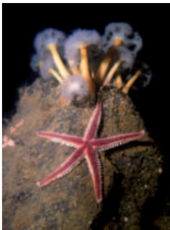
Mořská hvězdička a sasanky karafiátové