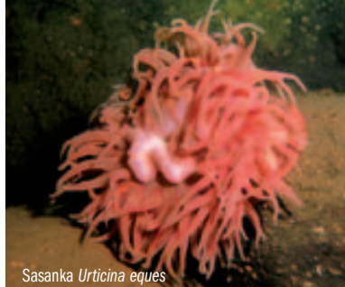
Sasanka Urticina eques

Po dvou dnech plavby, během kterých jsme uskutečnili další 4 ponory se dostáváme 200 km od Solovětského ostrova na nejsevernější část naší plavby. Plánujeme ponor v proudu podél jižní strany ostrova Velikyj, který je přírodní rezervací. Leží přesně na polárním kruhu a jeho rozloha je asi 50 km 2 . Ponory v proudu se tady odvíjejí od přílivu a odlivu. Půjčujeme si tedy od kapitána tabulku přílivů pro tuto oblast a volíme ideální čas ponoru. Kartěš kotví na hloubce a my jedeme na člunech k ostrovu. Profil ponoru