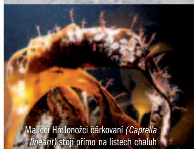
Malíček Hrdlonožci čárkovaní ( Caprella linearis ) stojí přímo na listech chaluhy