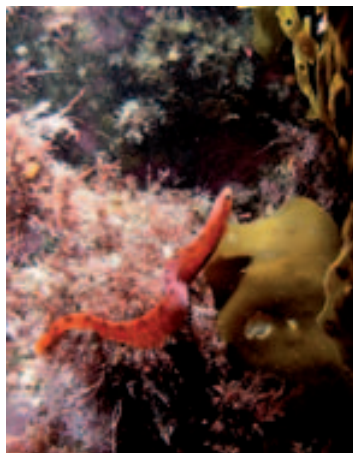
Mečitka ( Pholis gunnellus )