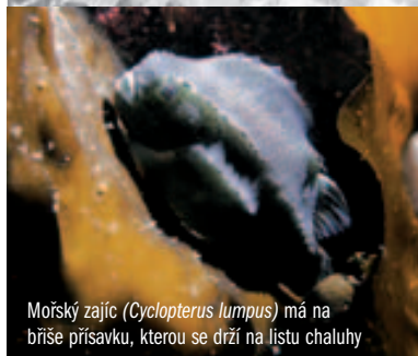
Mořský zajíc ( Cyclopterus lumpus ) má na břiše přísavku, kterou se drží na listu chaluhy