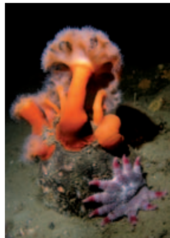
Mořská hvězdička a sasanky karafiátové