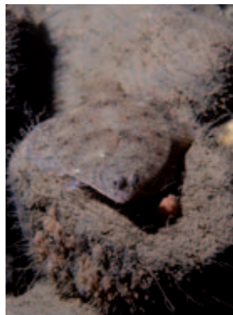
Platýz je dokonale maskován a splývá s barvou dna